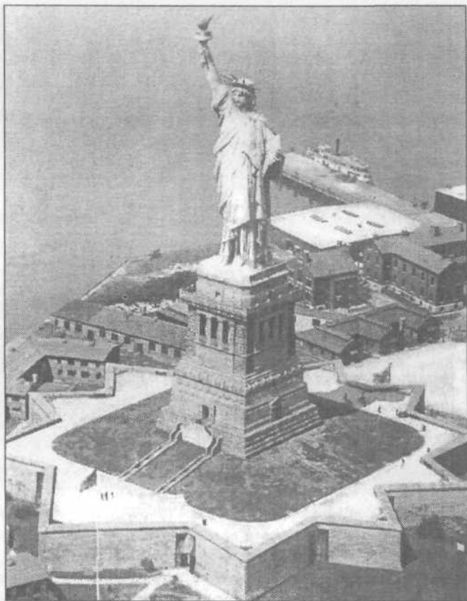
A New York-i Szabadság-szobor