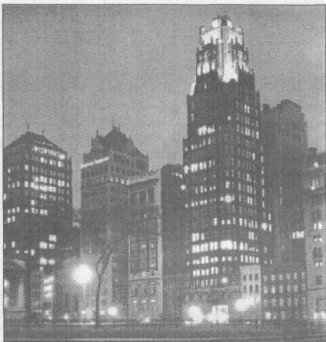
Felhőkarcolók New Yorkban

legnagyobb báltermében a testvéri szeretet, összetartás kívánalma hangzott a magyar, Kossuth Lajos magasztalása, s a magyarok dicsérete az amerikai szónokok ajkáról.